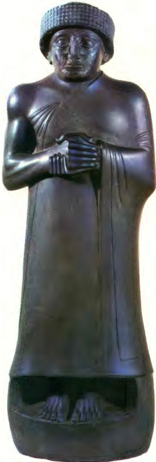
Estatua de diorita del rey Gudea, de la segunda época de Lagash, que reinó hacia 2400 a. de J. C. (Museo del Louvre, París).

dos hombres. Urukagina redujo a la mitad las tarifas para los funerales y las de los oráculos por el aceite. Cada raza tiene una manera distinta de augurar el porvenir, y los sumerios obtenían oráculos echando aceite en la superficie del agua, y examinando las formas de las manchas podían predecir los acontecimientos.